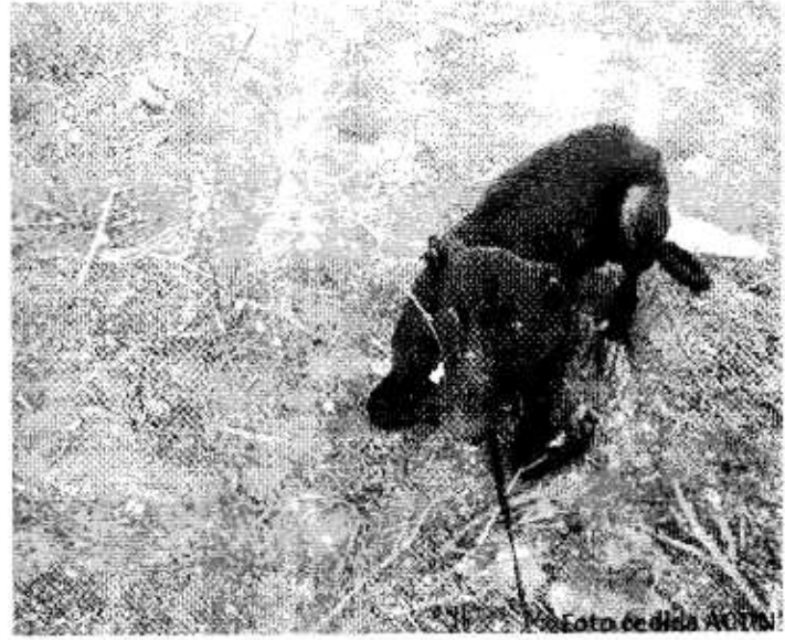
Fig. 1. El perro fue abandonado dentro de un saco en medio del campo para que muriera de hambre. Fig. 2. Rescatado por personal de la Asociación ACTIN.

Por todo lo expuesto anteriormente, Unión Progreso y Democracia propone al Pleno el siguiente acuerdo: