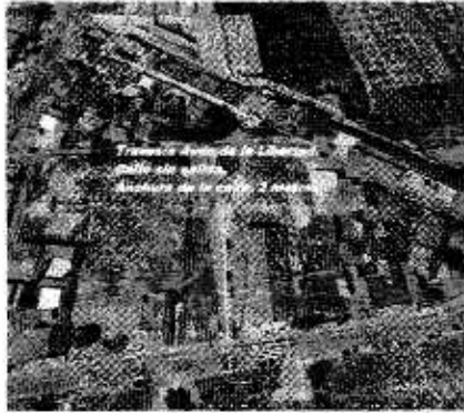
PLANO GENERAL DE LAS 4 ZONAS OBJETO DE LA MOCIÓN

4.º- Faltan obras de urbanización de la calle Avenida de San Ginés, entre los números 2 y 12 conforme a las características fundamentales recogidas para la misma en Plan General de Ordenación Urbana.