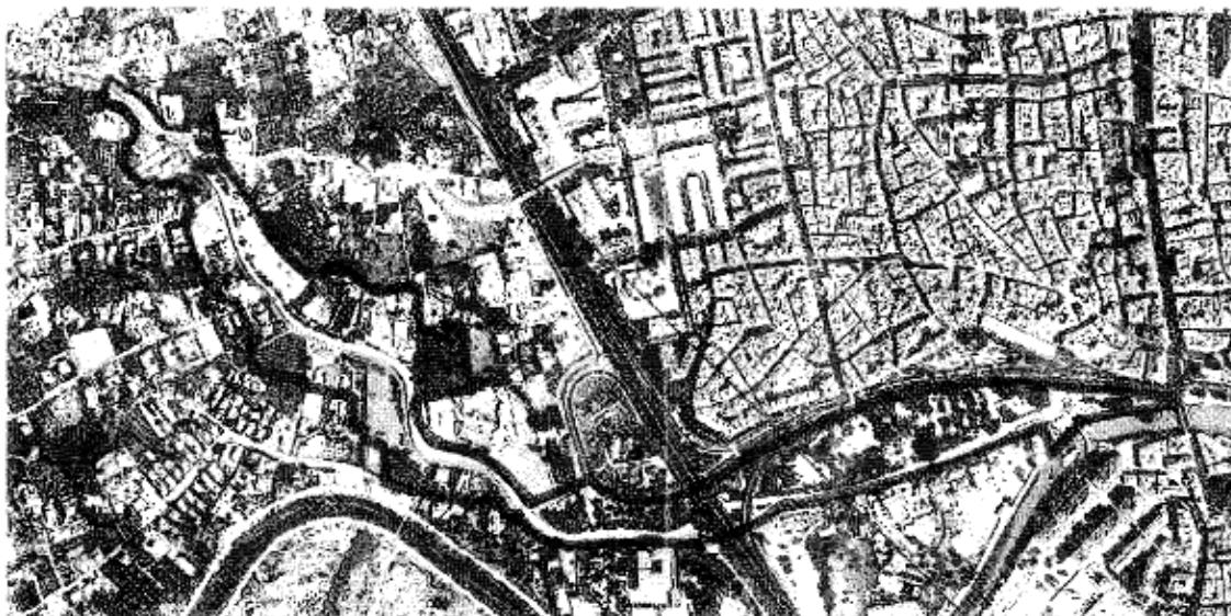
Fig. 1. Límites propuestos por el Ayuntamiento para el 'entorno BIC del Malecón'

En la inspección de estos límites propuestos, hemos observado cierta falta de coherencia en su establecimiento, tanto en las zonas construidas como de los huertos o terrenos baldíos, de la parte Sur sobre todo; pues terrenos con las mismas tipologías y colindantes han sido tratados de forma diferente, lo que presupone cierta arbitrariedad en su delimitación o falta de criterio.