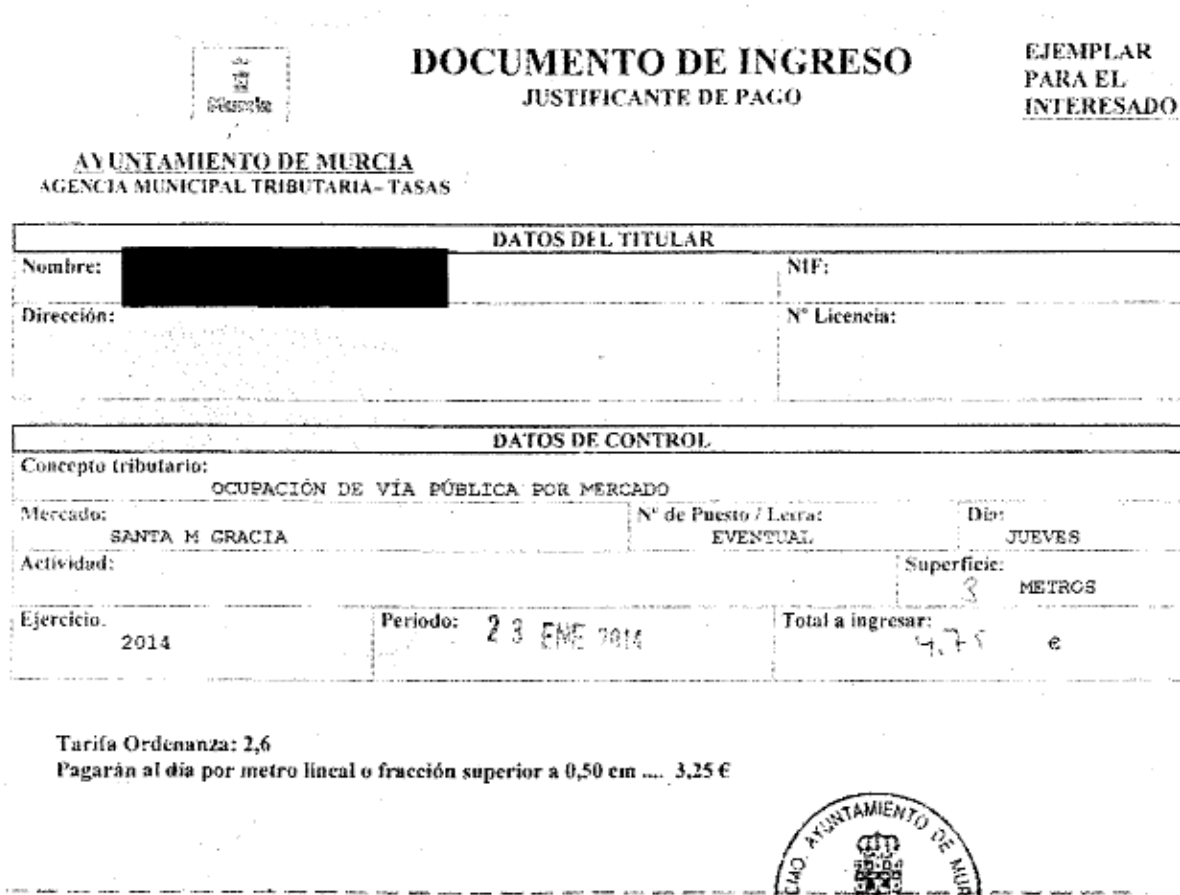
Figura 2. Detalle de recibo que se está dando en la actualidad a los vendedores ambulantes

Para nada es consentible el tipo de recibo que en la actualidad se expide, tal como se refleja en la Fig. 2