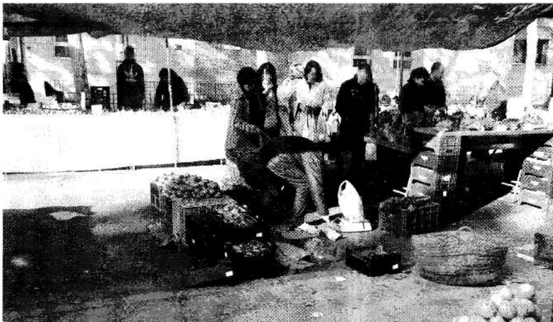
Figura 1. Vendedor en el mercadillo semanal de La Fama con mercancía de dudosa procedencia

Algunas de estas medidas eran tan sencillas y fáciles de tomar, como colocar un cartel en cada puesto para que los clientes pudieran identificar fácilmente a los vendedores que se encuentran en regla de aquellos que no lo están.